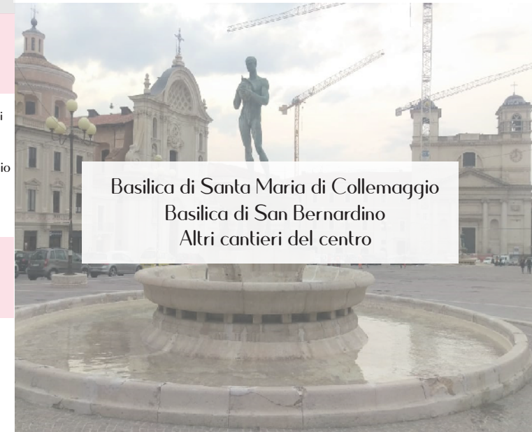
Basilica di Santa Maria di Collemaggio Basilica di San Bernardino Altri cantieri del centro